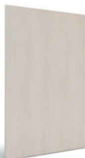
articolo 574 schienale in TANGANICA I. 128. TANGANICA backrest I. 128. cm. p. 128 h. 226 sp. 1,8