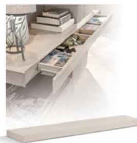
articolo 776 mensola con segreto chiusura push and pull. shelf with secret and with soft closing. cm. l. 189 p. 50 sp. 8