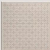
anta decoro per base o pensile. decorative door for base or hanging.

all modules are calculated with frame door in case you want the decorative door we must add: