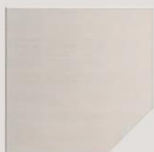
anta smussata. blunted door.