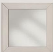
anta telaio. frame door.