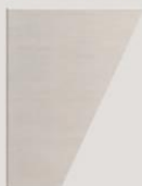
anta tagliata per pensile quadrato. cut door for square hanging.