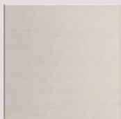
anta liscia. smooth door.