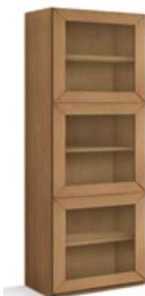
articolo 75 colonna 3 ante. 3 doors column. cm. l. 63 p. 36,5 h. 192