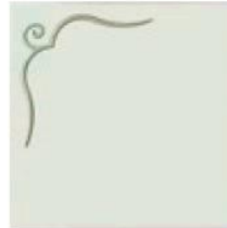
articolo 48SX anta push pull con rilievo. push pull door with relief. cm. l. 63 sp. 1,8 h. 63