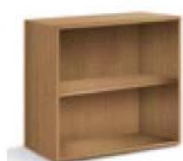
articolo 61 pensile a giorno. compartment hanging. cm. l. 63 p. 36,5 h. 63