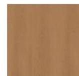
articolo 56 pannello liscio per art. 53. smooth panel for art. 53.