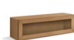
articolo 63 pensile ante vetro a ribalta. 1 glass door reverse hanging. cm. l. 126 p. 36,5 h. 34