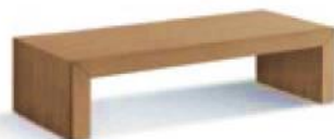
articolo 69 tavolino rettangolare basso. small rectangular coffee table. cm. l. 126 p. 55 h. 25