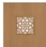
articolo 55 pannello traforato per art. 53. perforated panel for art. 53.