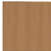
articolo 52 anta push pull liscia. push pull smooth door. cm. l. 63 sp. 1,8 h. 63