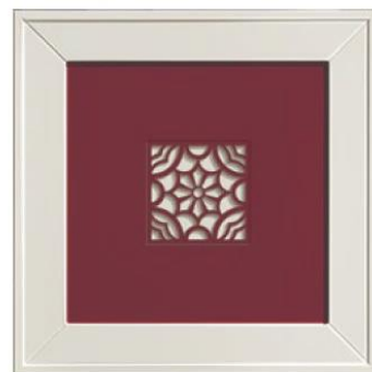
anta traforo BORDÒ. perforated door.