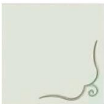
articolo 51SX anta push pull con rilievo. push pull door with relief. cm. l. 63 sp. 1,8 h. 63