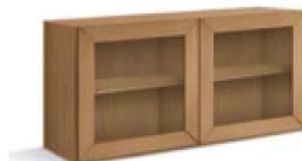
articolo 62 pensile 2 ante vetro. 2 glass doors hanging. cm. l. 126 p. 36,5 h. 63