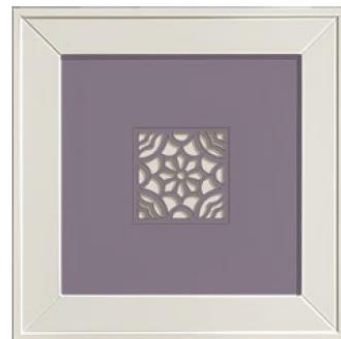
anta traforo VIOLA. perforated door.