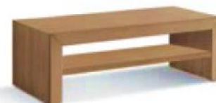
articolo 70 tavolino alto con mensola. coffee table with shelf. cm. l. 126 p. 55 h. 45