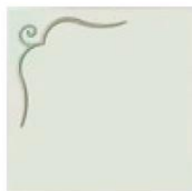
articolo 51DX anta push pull con rilievo. push pull door with relief. cm. l. 63 sp. 1,8 h. 63