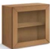
articolo 60 pensile 1 anta vetro SX o DX. 1 glass door SX o DX hanging. cm. l. 63 p. 36,5 h. 63