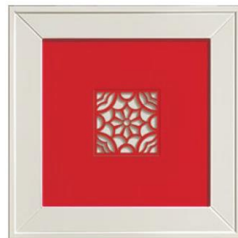
anta traforo ROSSO. perforated door.