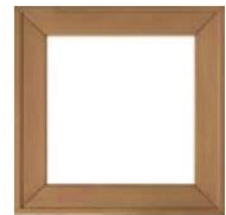
articolo 53 anta telaio senza pannello. frame door without panel. cm. l. 63 sp. 1,8 h. 63