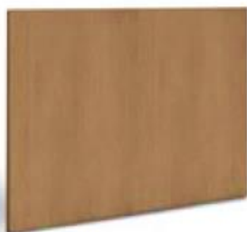
articolo 46 schienale centrale porta TV. central back for TV stand. cm. l. 130 sp. 1,8 h. 99