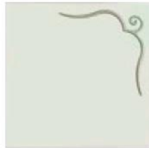
articolo 50DX anta push pull con rilievo. push pull door with relief. cm. l. 63 sp. 1,8 h. 63