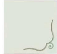
articolo 48DX anta push pull con rilievo. push pull door with relief. cm. l. 63 sp. 1,8 h. 63