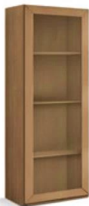
articolo 71 colonna 1 anta. 1 door column. cm. l. 63 p. 36,5 h. 192