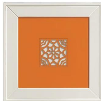
anta traforo ARANCIO. perforated door.