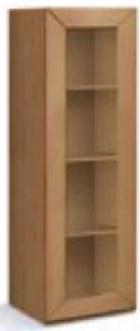
articolo 64 pensile verticale 1 anta vetro. 1 glass door vertical hanging. cm. l. 34 p. 36,5 h. 126