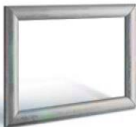
articolo 47 cornice centrale porta TV. central frame TV stand. cm. l. 130 sp. 2,7 h. 99