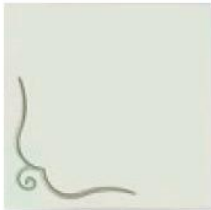
articolo 50SX anta push pull con rilievo. push pull door with relief. cm. l. 63 sp. 1,8 h. 63

Una linea di mobili dal design lineare e dalla personalità raffinata, dove agglomerati e legno si accostano in perfetta armonia. Le ante delle madie sono prive di maniglie e si aprono mediante sistema a spinta (push-pull) dotato di calamita per una perfetta chiusura. L'attenzione ai dettagli è massima, e proprio per questo non trascuriamo importanti particolari come i piedi, che sostengono l'intera struttura, realizzati in materiali inossidabili e tinteggiati con un'elegante finitura, si ergono con eleganza sottile dando l'idea a tutta la struttura di una sospensione immateriale.