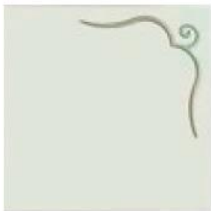
articolo 49SX anta push pull con rilievo. push pull door with relief. cm. l. 63 sp. 1,8 h. 63