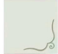
articolo 48DX anta push pull con rilievo. push pull door with relief. cm. l. 63 sp. 1,8 h. 63