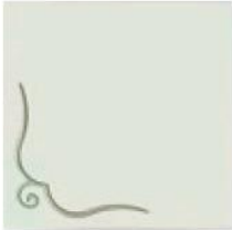
articolo 50SX anta push pull con rilievo. push pull door with relief. cm. l. 63 sp. 1,8 h. 63

Una linea di mobili dal design lineare e dalla personalità raffinata, dove agglomerati e legno si accostano in perfetta armonia. Le ante delle madie sono prive di maniglie e si aprono mediante sistema a spinta (push-pull) dotato di calamita per una perfetta chiusura. L'attenzione ai dettagli è massima, e proprio per questo non trascuriamo importanti particolari come i piedi, che sostengono l'intera struttura, realizzati in materiali inossidabili e tinteggiati con un'elegante finitura, si ergono con eleganza sottile dando l'idea a tutta la struttura di una sospensione immateriale.