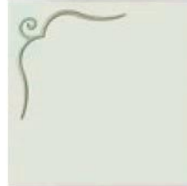
articolo 48SX anta push pull con rilievo. push pull door with relief. cm. l. 63 sp. 1,8 h. 63