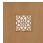
articolo 55 pannello traforato per art. 53. perforated panel for art. 53.